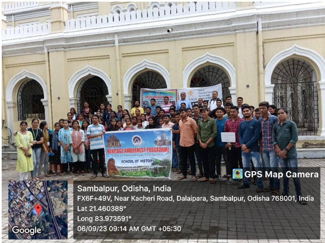
Heritage Walk from town hall to Lakshinath bezbaroa house