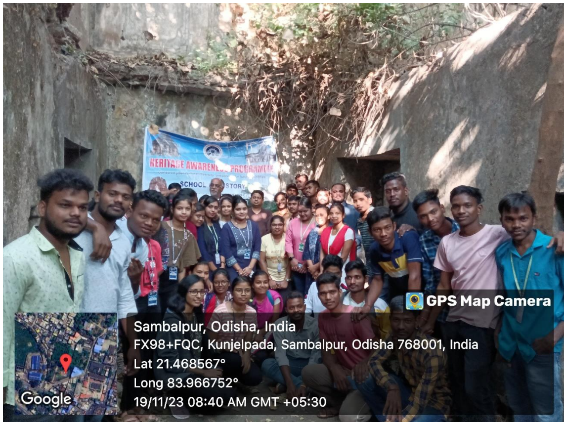
Celebration of World Heritage Week 2023 at Raja Bakhri