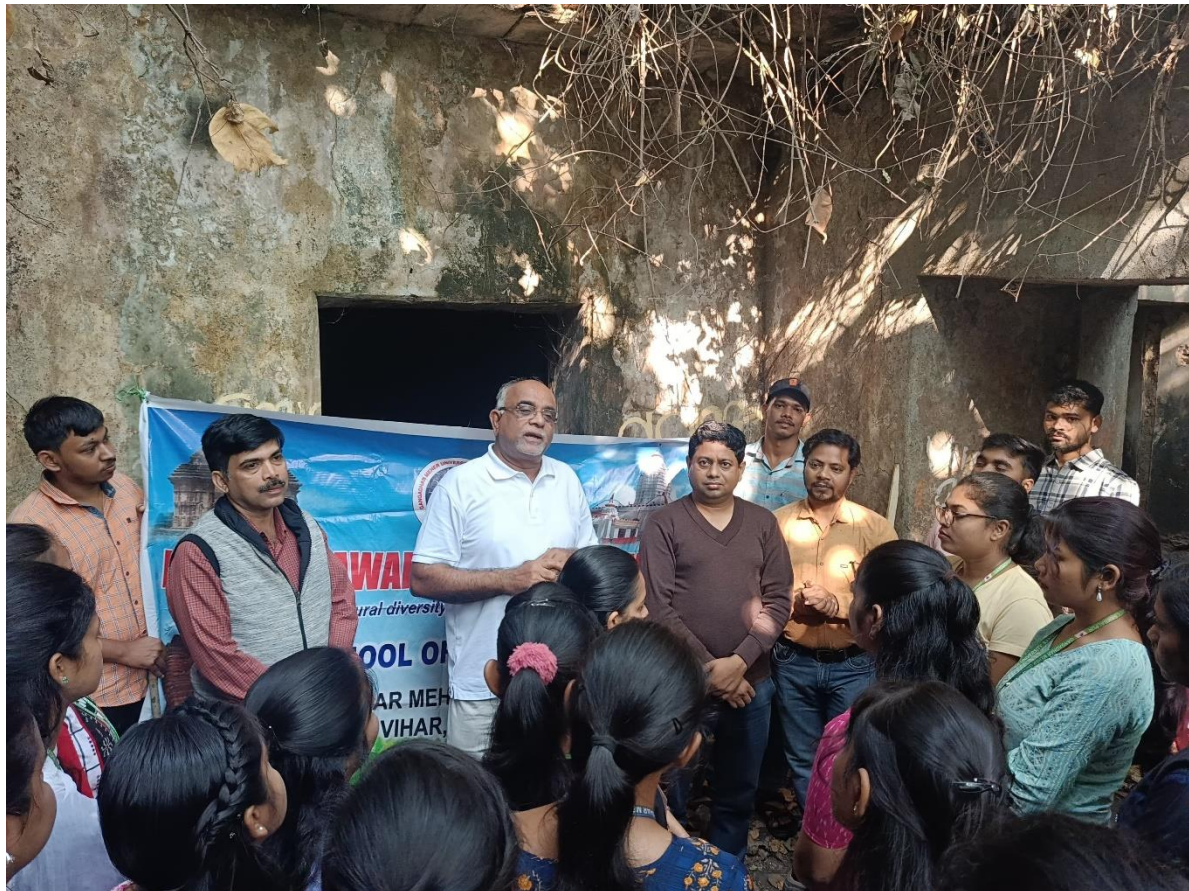
Celebration of World Heritage Week 2023

Conserve your cultural diversity, preserve it for future identities