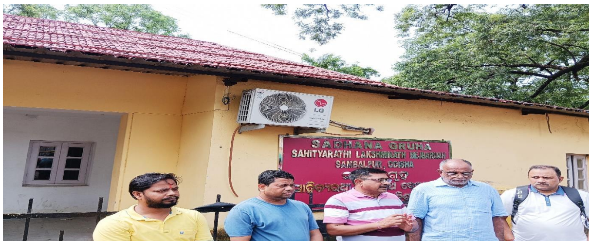
Resource persons, and participants in the Heritage Walk from town hall to Lakshinath Bezbaroa house