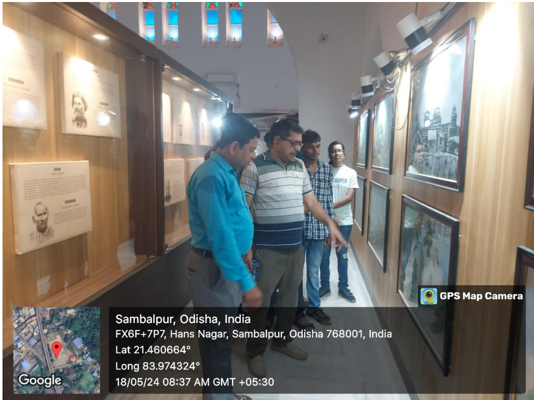
International Museum Day observed at Veer Surendra Sai hall 2024