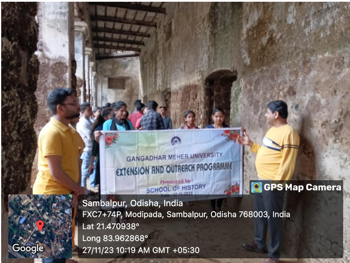
Heritage Awareness programme at Patna house