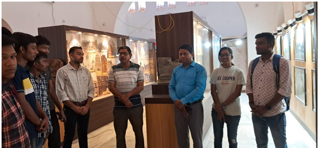
International Museum day observed at Veer Surendra Sai hall 2024