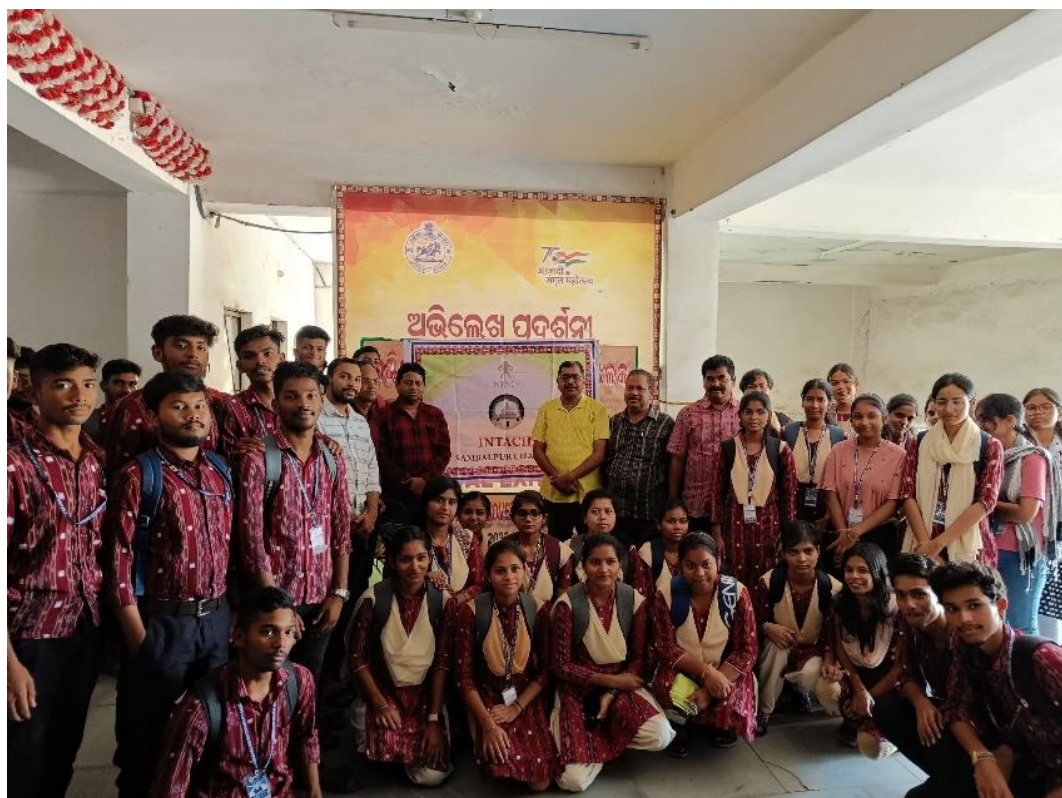
Students participated in the World Heritage day programme 2024