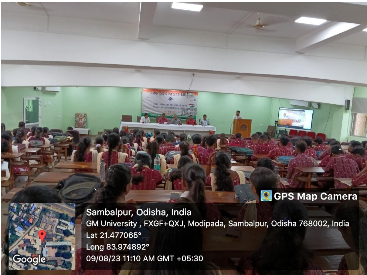
Observation of August Kranti on 9 th August 2023