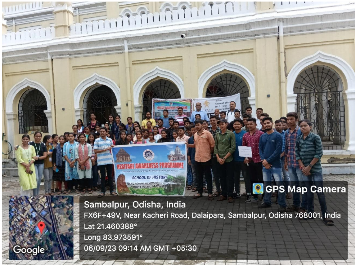
Students and participants in the Heritage walk