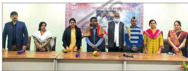
'ଭାରତର ପରିବର୍ତ୍ତିତ ଜନସଂଖ୍ୟା ବୟସ୍କଙ୍କ ସଂଖ୍ୟା ୨୦ ପ୍ରତିଶତରୁ ଅଧିକ' ଯେଉଁଠାରେ ଆଠିଏ ବର୍ଷରୁ ଅଧିକ ବୟସ୍କଙ୍କ ସଂଖ୍ୟା ତା ଉପରେ ଏହି ଚଳଚ୍ଚିତ୍ରଟି ପର୍ଯ୍ୟବସିତ।